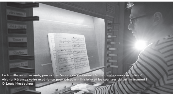
En famille ou entre amis, percez Les Secrets de du Grand Orgue de Rocamadour grâce à Airbnb. Réservez votre expérience pour découvrir l'histoire et les coulisses de cet instrument !

Cette année, 2 stages d'été Cantica Sacra sont organisés : le premier du 12 au 19 août et le second du 19 au 26 août. Inscription sur www.rocamadourfestival.com