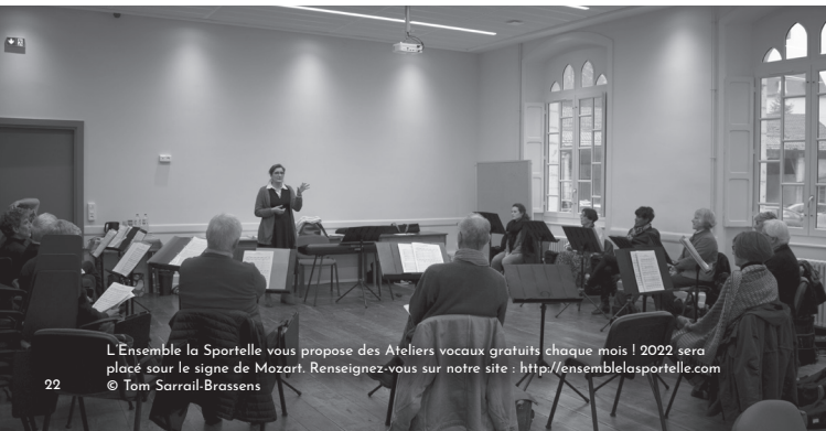
L'Ensemble la Sportelle vous propose des Ateliers vocaux gratuits chaque mois ! 2022 sera placé sous le signe de Mozart. Renseignez-vous sur notre site : http://ensemblelasportelle.com