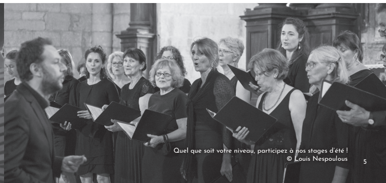
Quel que soit votre niveau, participez à nos stages d'été !