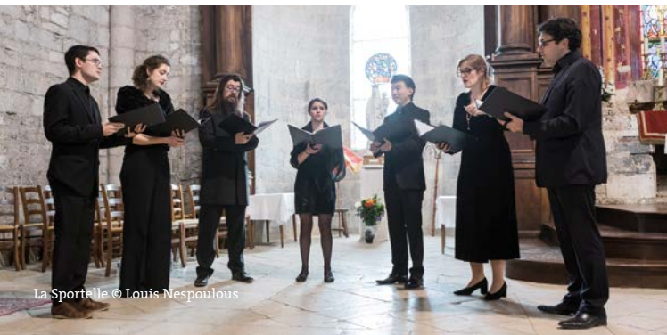
La Sportelle © Louis Nespoulous