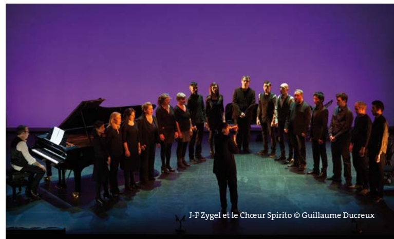
J-F Zygel et le Chœur Spirito