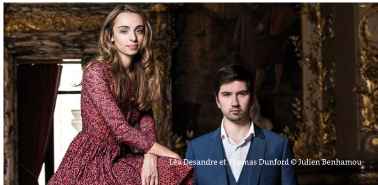
Léa Desandre et Thomas Dunford