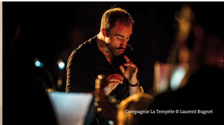
Compagnie La Tempête