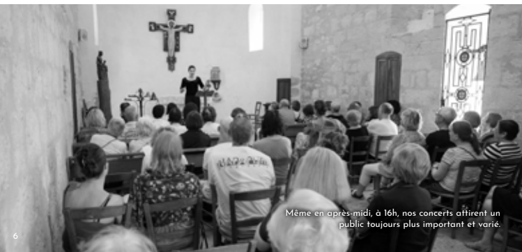
Même en après-midi, à 16h, nos concerts attirent un public toujours plus important et varié.