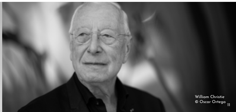
William Christie