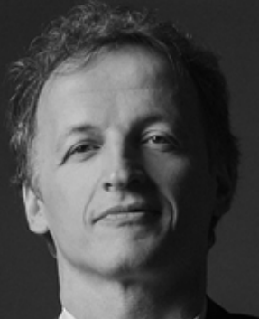
Jean-Christophe Spinosi

Voyage au cœur d'une musique éminemment française passant des mélismes grégoriens de Duruflé aux dramatiques regards des motets d'Escaich. C'est là l'essence du style français : retenu et exacerbé, mais toujours fusionnel avec le texte.