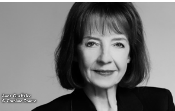
Anne Queffélec