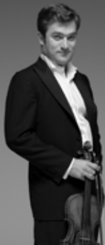
Renaud Capuçon